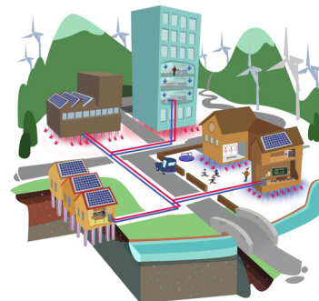
Med Energipælene sørger bygningens fundament både for den mekaniske stabilisering af bygningen, men fungerer også som køle- og varmeforsyning.

I en animationsvideo giver Centrum Pæle et fyldstgørende indblik i, hvordan energipælene fungerer. Videoen finder man på www.youtube.com/watch?v=O-LurIyecGLI&t=25s